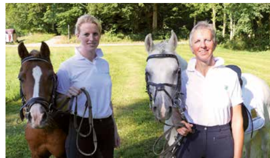
Fotos: Sport-, Ergotherapie und Bewegungsbad, Hippo-Therapie